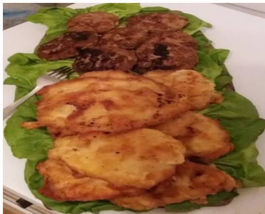
Schnitzel und Fleischpflanzerlplatte