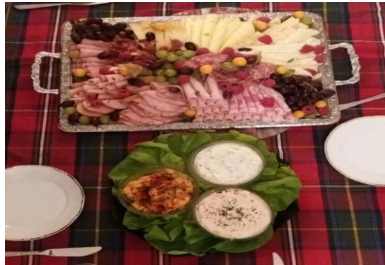
gemischte kalte Bayerische Brotzeitplatte