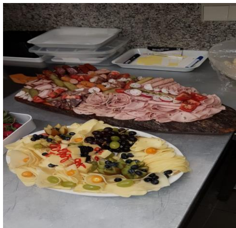
Wurst- und Käseplatte